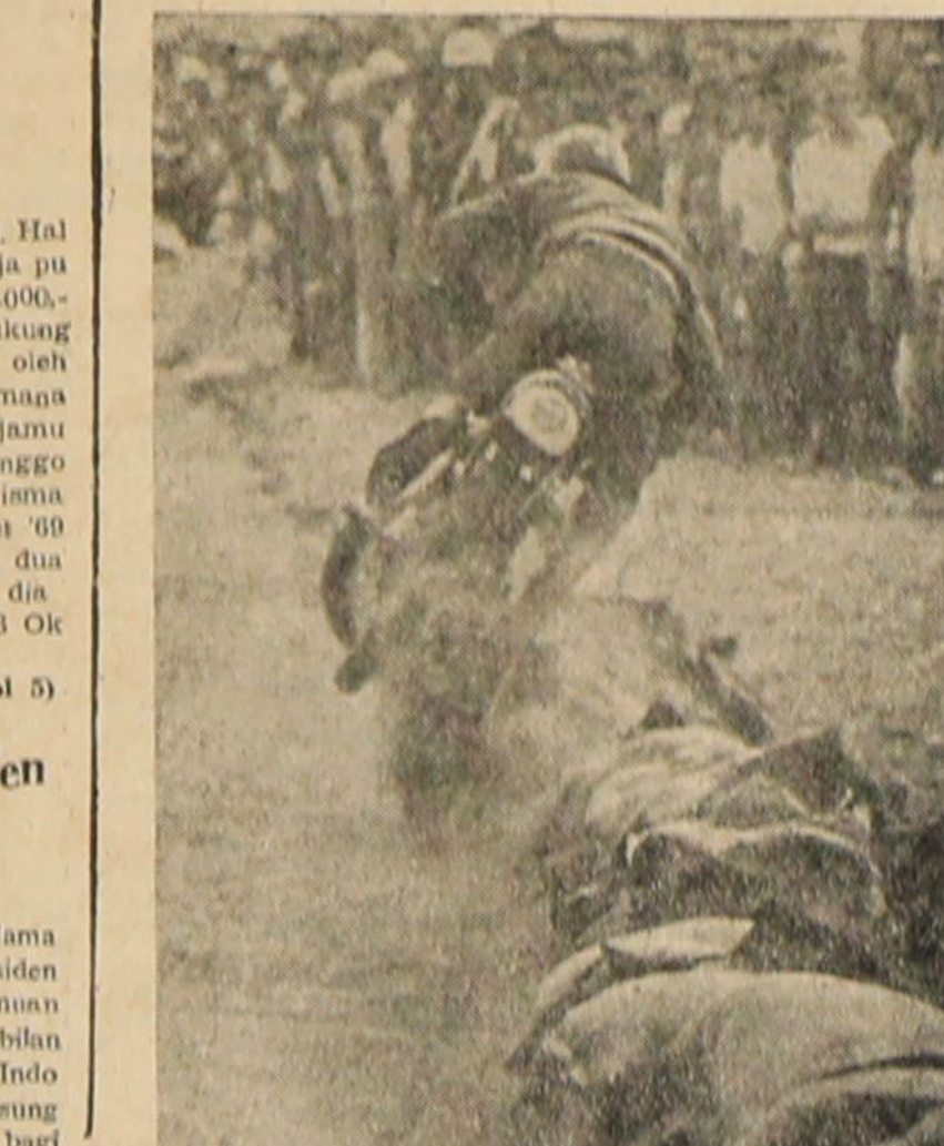
BALAPAN motor tanpa ketjelakan, tidak seru kata para penonton. Inilah salah satu adegan dalam 'Jaya Antjol Motor Race' di Istana Negara...